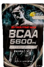
マイルーティーン MAX BCAA5600