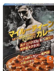
マイルーティーン カレー 中辛