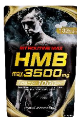
マイルーティーン MAX HMBmax3500