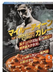
マイルーティーン カレー 中辛