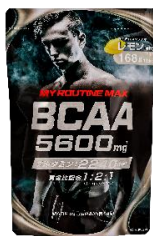
マイルーティーン MAX BCAA5600