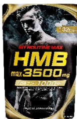
マイルーティーン MAX HMBmax3500