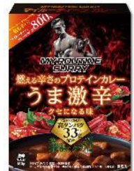
マイルーティーン カレー うま激辛