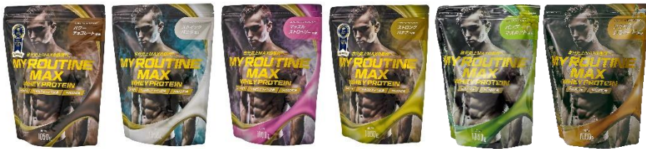
(左から) パワーチョコレート風味 / スティックバニラ風味 / マッスルストロベリー風味 / ストロングバナナ風味 パンプマスカルット風味/アクセラレモネード風味

「MY ROUTINE MAX (マイルーティーン マックス) 1,050g」は、1食あたりタンパク質量25g以上、 最大26.8g 摂取できる 配合量を実現しています。(フレーバーにより異なります。)