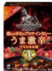
マイルーティーン カレー うま激辛