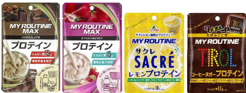
マイルーティーンプロテイン

大きく広がっているプロテイン市場において、プロテイン飲料やプロテインバーなど人によって摂取方法は様々です。その中でもタンパク質を効率的に摂取できるという、本来の目的に一番合ったプロテインパウダーの需要は高く、様々なプロテイン摂取シーンや使用者がいるからこそ自分に合ったプロテインを見つけられていない方にとってパウダーは必要だと考えられます。近年コンビニでもプロテイン商品は増