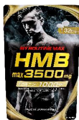
マイルーティーン MAX HMBmax3500