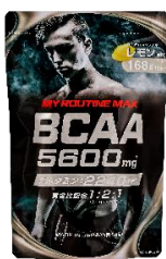
マイルーティーン MAX BCAA5600