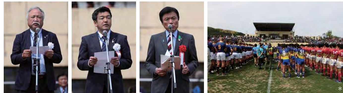
(公財) 日本ラグビーフットボール協会 森重隆副会長 (当時)