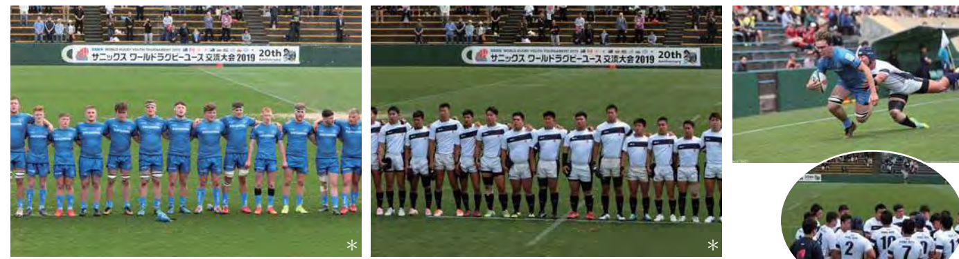
試合前のセレモニーでは、両国国歌を吹奏します。エクセター カレッジ (イングランド) 対大阪桐蔭高等学校。