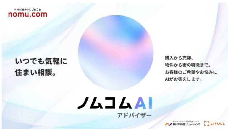
【ノムコム AI アドバイザーコンテンツページ】

ご参考：ノムコム AI アドバイザー URL https://www.nomu.com/ai/