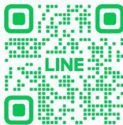
【ノムコム公式 LINE アカウント 二次元コード】