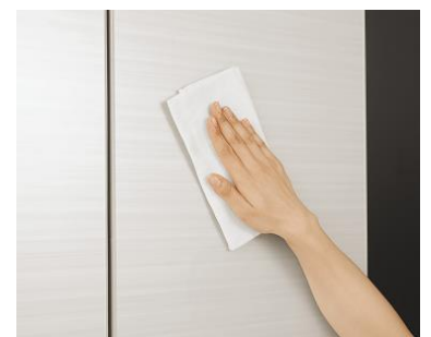
<お手入れしやすい、強化処理ガラスドア>

センサーにより24時間自動で効率運転するecoモードを装備。オプション設定(節電機能 ※2 )でさらに節電することができます。