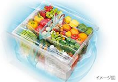
<うるおいラップ野菜室>

野菜室の密閉度を高め、うるおいを閉じ込めることで野菜のみずみずしさを保ちます。また、野菜の量が減り庫内が低湿度になると「うるおい補給カセット」からうるおいを放出して湿度をコントロール。野菜の乾燥を防いで鮮度を保つから、まとめ買いした野菜や料理後に残った野菜も美味しく使い切ることができます。