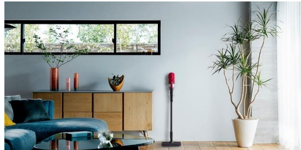
掃除中に壁に立て掛ける(イメージ)

* 本体を壁などに立てかける時は、必ず「切」にしてください。充電時や長時間の壁の立て掛けは、しないで下さい。立て掛ける時は部屋の隅や家具の間など、倒れにくい場所を選んで下さい。