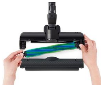
簡単に取り外せる回転ブラシ (イメージ)