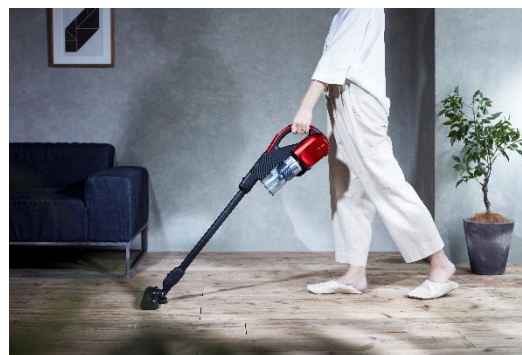
片手で軽く操作できるコードレスクリーナー (イメージ)