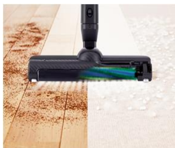
ワイド幅の「ラクトルパワーヘッド」 (イメージ)