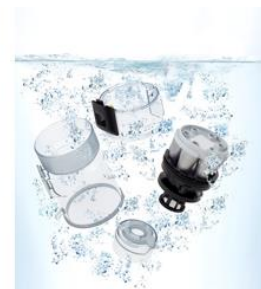
丸ごと水洗いできるサイクロンカップ (イメージ)