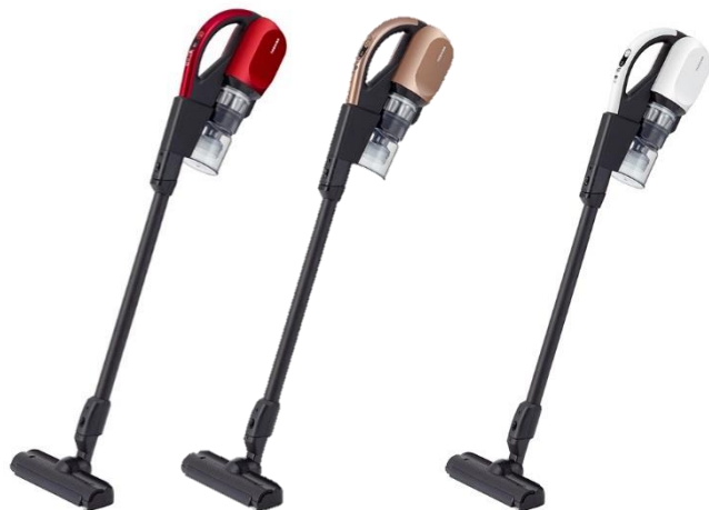
(R) グランレッド (N) ピンクブロンズ VC-CL1600

東芝ライフスタイル株式会社は、パワフルな吸引力が99%以上持続する 注3 コードレススティッククリーナーの新製品として、従来機種 注4 より本体体積を約15%削減しスリム化・軽量化を実現し操作性を高めたことに加え、連続運転時間を30分に向上した「TORNEO V cordless(トルネオVコードレス)VC-CL1600、VC-CL600の2機種を12月に発売します。