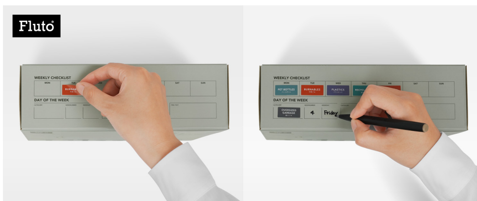
分別カレンダー(※意匠登録出願中)

従来のごみ出しは、自治体の分別冊子を確認しながら準備するのが一般的で、キッチンでは冊子とごみ袋が常にセットになりがちです。また、市販のごみ袋は商品情報が分かりやすい一方で、生活空間に置く際、デザインや情報の見え方が気になります。また、分別が細くなるほど、確認・準備・交換といった工程が増え、手間が積み重なります。