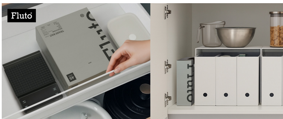
Fluto紐付きゴミ袋収納例

そこで私たちは、毎日の動線に自然となじみ、限られたスペースでもコンパクトに管理できることを前提に、パッケージから見直しました。落ち着いたグレーの箱に収め、縦置き・横置き・平置きのもので収納しやすく、すき間にも収まる設計に。必要なときに1枚ずつ引き出せる仕様で、交換の手間を減らしています。