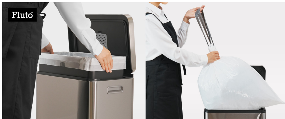
Fluto紐付きゴミ袋使用シーン

さらに口元は、幅2.7cmの紐をキュッと引くだけで閉じられる巾着仕様にし、結ぶ手間を減らして手も汚れにくい。袋は厚手のLDPEのつるつるフィルムで、紐の引き出しがスムーズで、ストレッチ性があり、重いごみや角のあるごみでも破れにくく裂けにくいのが特長です。袋を結ばない分、容量いっぱいまで入れやすく、耐水性で水漏れも防ぎます。また、中身が透けにくい乳白色でプライバシーを守り、日々の使い心地の良さを目指しました。