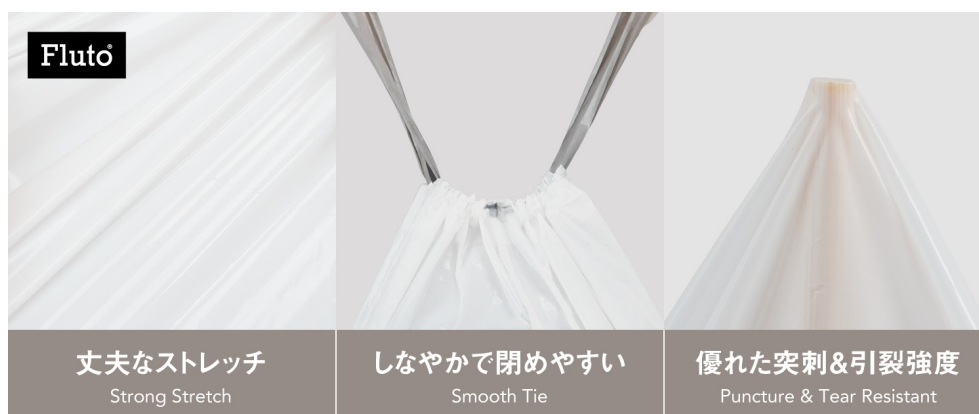
Fluto紐付きゴミ袋の特徴

さらに口元は、幅2.7cmの紐をキュッと引くだけで閉じられる巾着仕様にし、結ぶ手間を減らして手も汚れにくい。袋は厚手のLDPEのつるつるフィルムで、紐の引き出しがスムーズで、ストレッチ性があり、重いごみや角のあるごみでも破れにくく裂けにくいのが特長です。袋を結ばない分、容量いっぱいまで入れやすく、耐水性で水漏れも防ぎます。また、中身が透けにくい乳白色でプライバシーを守り、日々の使い心地の良さを目指しました。