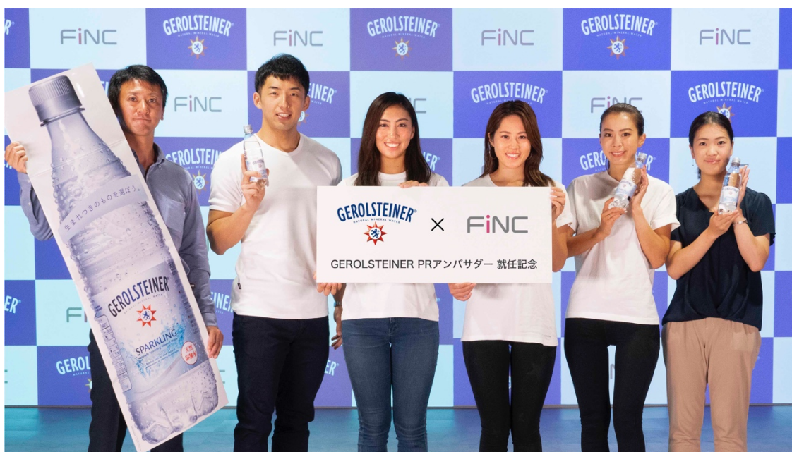
(ポッカサッポロ「ゲロルシュタイナー」ブランド担当 上村氏らと「ゲロルシュタイナー」PR アンバサダー)

FiNC アプリに「ゲロルシュタイナー」PR アンバサダーも参加します。アンバサダーにはアスリートやモデルなどが就任し、「ゲロルシュタイナー」との日常を紹介し、FiNC アプリを盛り上げます。