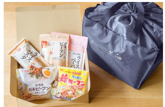
レジカゴサイズのコラボエコバッグとケンミン食品商品が入ったスペシャルセット ※商品は変更になる場合がございます。

https://www.kenmin.co.jp/campaign/macaronicamp_202008.html