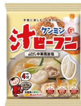
スープタイプの 「中華風旨塩スープ」

お鍋ひとつで煮込んで作るスープタイプのビーフンです。ごま油や生姜が効いた、中華風の塩味です。 内容量 81g (ビーフン 46g、液体スープ 35g) 価格 115円 (税抜)