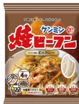
スパイシーな 「幻のカレー味」

1980年代に発売した焼ビーフンカレー味を現代風にアレンジした、スパイスの香りと後味がクセになるスパイシーな焼ビーフンです。 内容量 58g (ビーフン 50g、粉末ソース 18g) 価格 115円 (税抜)