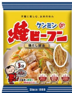
ベーシックな 「鶏だし醤油味」

味付けタイプのビーフンでゆで戻し不要です。鶏のだしが効いた昔ながらの醤油味です。 内容量 65g (味付きビーフン) 価格 115円 (税抜)