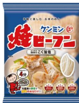
あっさりした 「こく旨塩味」

ホタテの風味と豚脂のこくが効いた、飽きのこないやさしい塩味です。 内容量 70g (ビーフン 50g、液体ソース 20g) 価格 115円 (税抜)