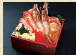
【魚と肉と北海道 蔵】 えびかに合戦弁当 ※当コーナーでは、現金、交通系ICカード、クレジットカードでのお支払いが可能です。 ※掲載写真はイメージです。会場での盛り付けや容器が異なる場合がございます。また、出店者や出品品目が予告なく変更となる場合がございますので、予めご了承ください。