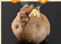
【夕張あさんど屋】 北あかりのジャンボじゃがバター塩辛のせ ※当コーナーでは、現金、交通系ICカード、クレジットカードでのお支払いが可能です。 ※掲載写真はイメージです。会場での盛り付けや容器が異なる場合がございます。また、出店者や出品品目が予告なく変更となる場合がございますので、予めご了承ください。