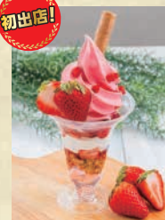
【うらかわ昔農園】 いちごソフトパフェ ※当コーナーでは、現金、交通系ICカード、クレジットカードでのお支払いが可能です。 ※掲載写真はイメージです。会場での盛り付けや容器が異なる場合がございます。また、出店者や出品品目が予告なく変更となる場合がございますので、予めご了承ください。