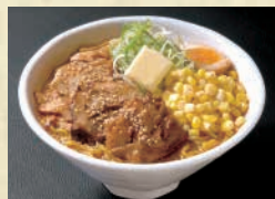
【札幌ラーメン武蔵】 北海道濃厚焼豚味噌らーめん ※当コーナーでは、現金、交通系ICカード、クレジットカードでのお支払いが可能です。 ※掲載写真はイメージです。会場での盛り付けや容器が異なる場合がございます。また、出店者や出品品目が予告なく変更となる場合がございますので、予めご了承ください。