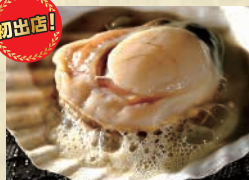
【風の幸】 北海道産ホタテの浜焼き ※当コーナーでは、現金、交通系ICカード、クレジットカードでのお支払いが可能です。 ※掲載写真はイメージです。会場での盛り付けや容器が異なる場合がございます。また、出店者や出品品目が予告なく変更となる場合がございますので、予めご了承ください。