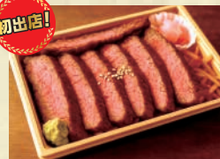
【道の駅なかかわ】 北海道産牛ステーキ弁当 ※当コーナーでは、現金、交通系ICカード、クレジットカードでのお支払いが可能です。 ※掲載写真はイメージです。会場での盛り付けや容器が異なる場合がございます。また、出店者や出品品目が予告なく変更となる場合がございますので、予めご了承ください。