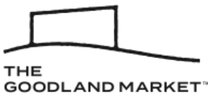
THE GOODLAND MARKET 株式会社URBAN RESEARCH

▶SDGsにちなんで、過去のアーカイブ商品を景品としたロボット金魚すくいを実施。