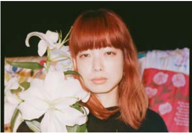
eri DEPT Company代表/デザイナー/ アクティビスト

気候危機を回避するため、人々が安全に暮らしていくためには社会システムそのものの変革が必要です。私たちがいるファッションやカルチャーも同じように新しい次のステップに進む変革の時だと考えています。私たちに何ができるかを考えている中でお話を受けたのがこの夜市の企画でした。今までのイベントの在り方が“作って壊して捨てる”だったとすると“作って捨てずに循環させる”という新しい考え方にどうシフトし実践できるかをスタッフの皆さんと作り上げた今回の企画です。皆さんに楽しんでいただき、また一緒に未来を作るためのビジョンを共有できるきっかけになることを願っています！