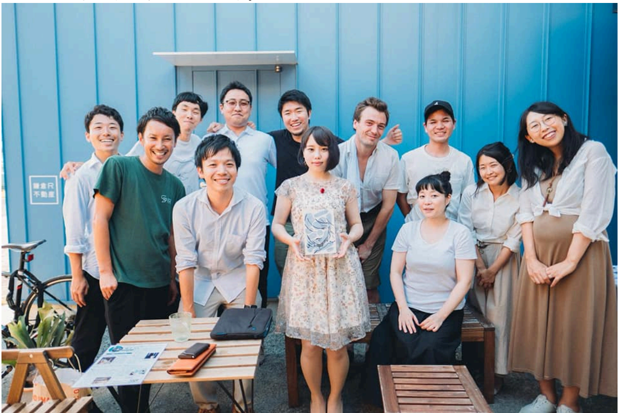
【写真】アーティストシェアハウスのメンバーたちが共に企画実地した個展「静かな休日。」より

東京・千葉・大阪で全10棟300人規模のコミュニティ重視型のコンセプトシェアハウス「絆家」をプロデュースする株式会社絆人(住所:東京都板橋区徳丸1-17-12)は、社会課題をアートによってユニークに解決する会社、ボンアート株式会社(住所:東京都江戸川区東葛西1-36-9)と連携し、「アーティストとクリエイターだけが暮らすアーティスト版トキワ荘」をコンセプトとした、アーティストシェアハウス第2弾を江ノ島・湘南エリアに2019年12月に本オープンします。