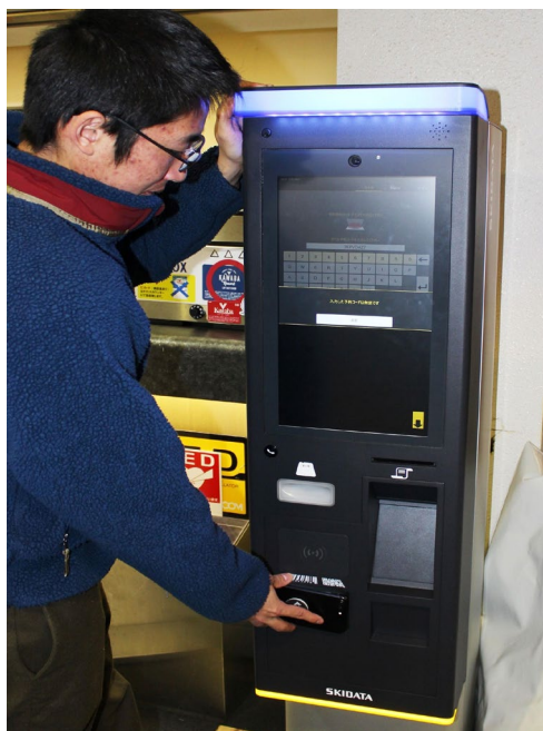
QRコードを表示させたスマホをかざすだけで、リフト券が発券！