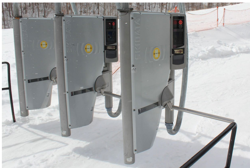
発券したリフト券をリフト 搭乗ゲートでタッチ！スムーズなゲレンデ・インが実現！