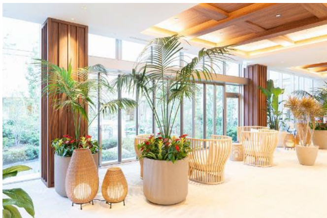
癒しの空間を演出したガーデンラウンジ