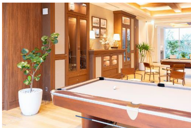
インテリアとの調和にも配慮したパークビューホール