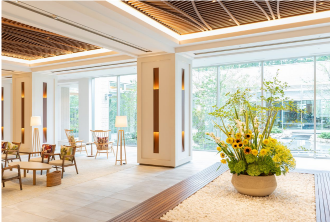
ロビーラウンジを旬の花々で華やかに演出