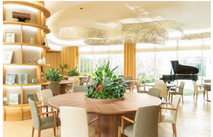
落ち着いた雰囲気を演出