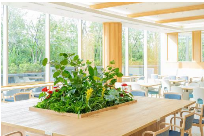
食事や会話を妨げないデザインの植栽

窓からの豊かな緑と合わせるようにテーブルの植栽の他にも多様な種類の植栽を設置することで、調和の取れた落ち着いた雰囲気的空間に仕上げました。