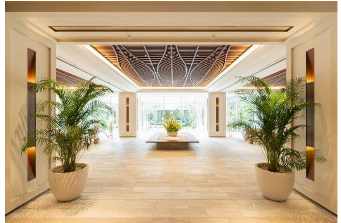
リゾート感を感じる植栽で癒しの空間をデザイン