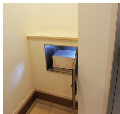
表に出ることなく宅内で荷物を回収