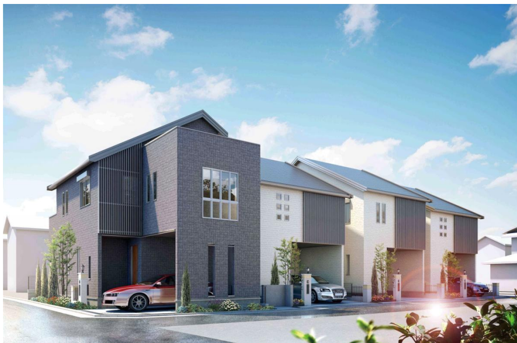
全棟「Z空調」搭載の「スマート・ワン シティ 浦和仲町 『Z空調』の家」イメージパース

当グループは利便性の高いエリアでの分譲住宅販売を行うと共に、これまで立地と価格だけに焦点が当てられていた分譲住宅市場に「性能」という新しい答えを加え、快適かつ経済的な「Z空調」のある暮らしが住まいのスタンダードとなるよう努め、子会社の桧家住宅ブランド5社、桧家不動産、レスコハウスが今後販売する分譲住宅に「Z空調」を全棟に搭載してまいります。