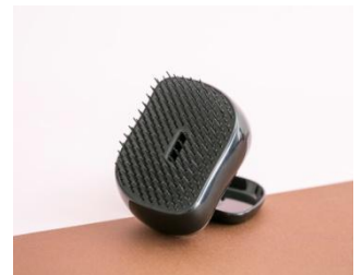
コンパクトスタイラー(グレースグリッター) ブラシ部分

「Depth ホワイトデーギフトセット 2020 SHARE」(セット価格:11,600円 税抜) Depth スカルプ マッサージ クレンジング FOR SHARE 200ml Depth スカルプ マッサージ トリートメント FOR SHARE 200g Depth スカルプ ケア エッセンス FOR SHARE 80ml コンパクトスタイラー(グレースグリッター)