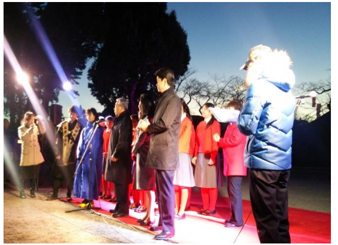
<点灯式会場の皆でカウントダウン>