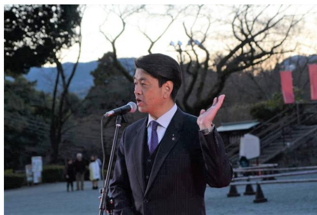
<加藤憲一 小田原市長の挨拶>