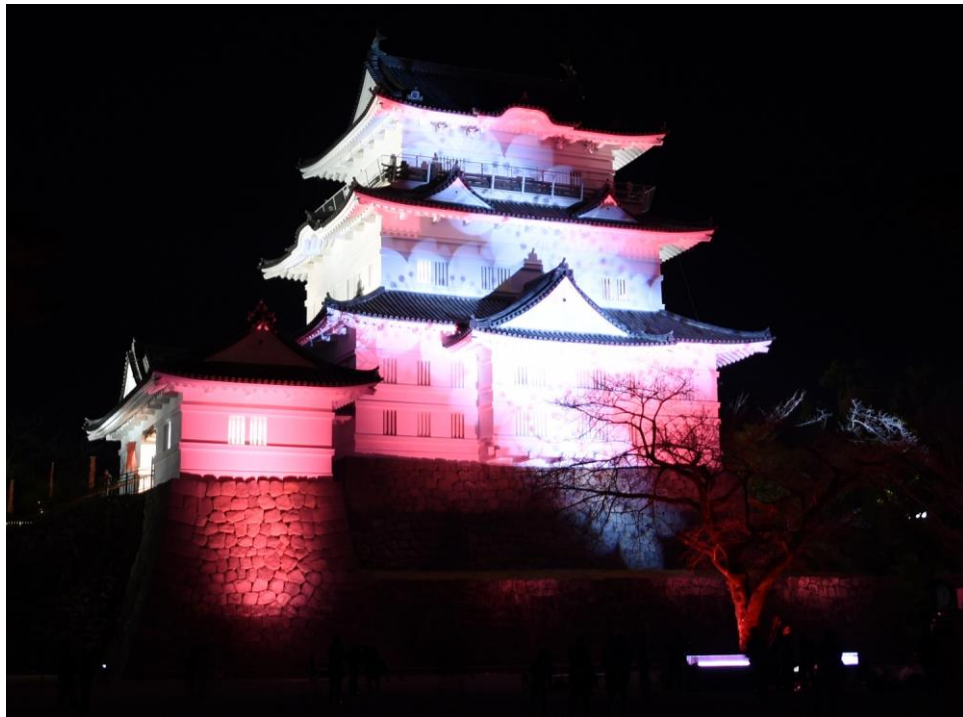
<美しくライトアップされる小田原城天守閣>