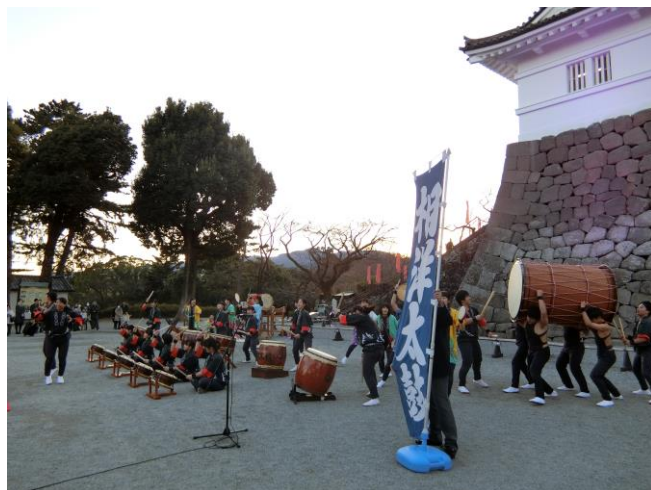
<相洋高校 和太鼓部のパフォーマンス>