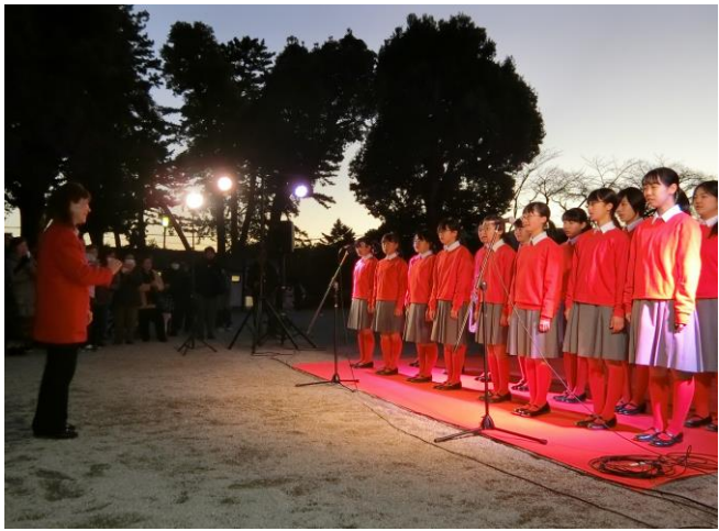
<小田原少年少女合唱隊の演奏>