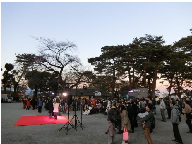
<点灯式には多くのお客様がお越しになりました>