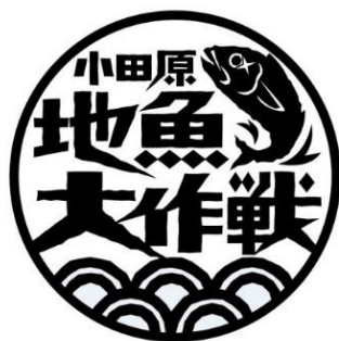
(小田原地魚大作戦協議会ロゴ)

「小田原の漁師ってカッコいい」をコンセプトに、地元漁師たちの素顔が分かるインタビューや迫力満点の動画、地魚を使った商品情報を紹介しています。