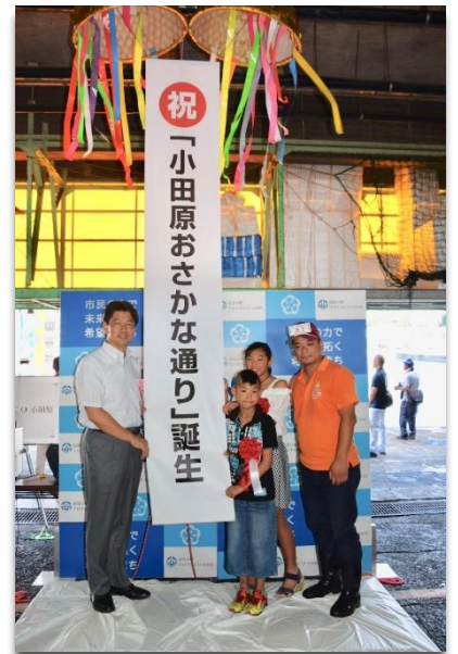
(小田原おさかな通りの発表)