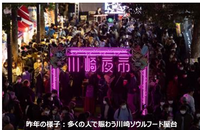
昨年の様子：多くの人で賑わう川崎ソウルフード屋台

川崎ソウルフード屋台を、JR川崎駅東口駅前広場に、ラ チッタデッラも加わり、2会場へ拡大。 川崎駅前バル祭りを、5日間、あとバルを含めて7日間に拡大。（昨年は4日間）