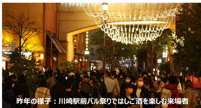
昨年の様子：川崎駅前バル祭りではしご酒を楽しむ来場者