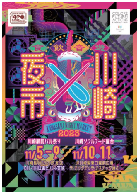
「川崎夜市」メインビジュアル

地元の名店が集まる屋台市場や、川崎駅前史上最大規模のはしご酒イベントなど、川崎特有の多様な食文化を広く発信し、川崎の夜を熱く彩ります！