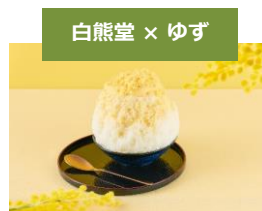
白熊堂 × ゆず

※ハーブティーセット2,100円 お店で育てた栄養価の高い野菜がたっぷり。ドレッシングは川崎のトマトにチアシードでサッパリ! ※TAKEOUT 可