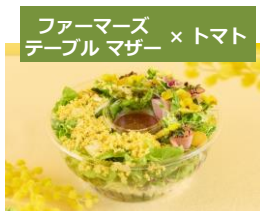
ファーマーズ テーブル マザー × トマト

香辛子の華やかな香りと海老の旨味を加えた特製スパイス&ハーブがホクホクのじゃがいもと絡む一品。食妙音厳選のクラフトジンとお楽しみください。