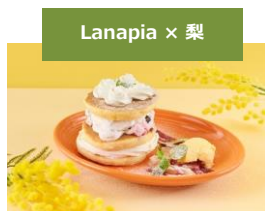
Lanapia × 梨

川崎では、野菜だけではなく果物やお花など様々な農産物が生産されています。「かわさきそだち」は川崎市内で生産された農産物の総称です。