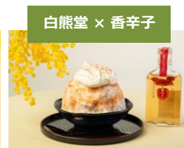
白熊堂 × 香辛子

かわさきそだちのゆずを使用した“ゆずホワイトチョコソース”が爽やかなかき氷です。