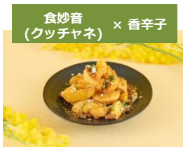
食妙音 (クツチャネ) × 香辛子

梨の自然な甘さが引き立つ様に、ベリーの酸味とホイップクリームのコクを合わせました。かわさきそだちの梨の風味を感じながらお召し上がりください。