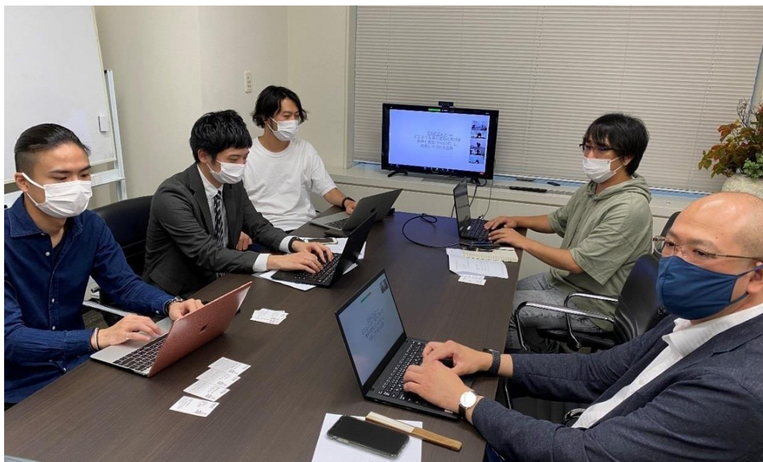
DX 推進チームミーティングの様子

DX 推進チームは、これまでに 6 月、7 月に 1 回ずつ、計 2 回の DX 推進ミーティングを開催しました。いずれの回においても、当社住宅のオーナー様向けサービスを開発する事業部を交え、DX への意識と現状の業務課題のすり合わせを行いました。さらに DCE からは、当社が DX により実現すべきビジョンの α 版（草案）として「どこよりも早く変化に気づき、素早く変化（へんげ）し、成長し続ける企業」を提示しました。DX 推進チームはこれに基づき、当社のサプライチェーンにおいて「KEIAI プラットフォーム」上で一気通貫でデータを集約・分析・レポートすることで市場の変化を察知し、社内リソースを素早く組み替え対応できる組織作りを目指すこととしました。