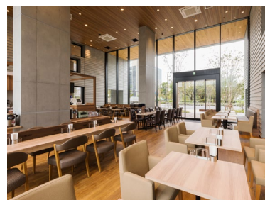
自然光の差し込む明るく あたたかみのある店内空間