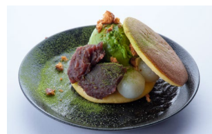
お食事だけでなく 和スイーツもおすすめ

朝食は2022年9月1日に新規オープンした「tomoru 茶屋」による和・洋・エスニックのビュッフェを無料でご提供します。あきたこまちの美味しいお米や、ベトナムのお米の麺「フォー」、ご当地飯の「深川めし」など、お米のこだわりがギュッとつまった朝食です。また、お食事、カフェスイーツ、お酒とおつまみなど、ご滞在中にご利用いただけるお食事券をチェックインの際にお渡しします。