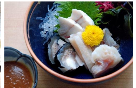
絶品！「あんこうの供酢」

本件に関するお問い合わせ先 茨城県大洗町役場 商工観光課 TEL: 029-267-5111 Mail: kankou@town.oarai.lg.jp