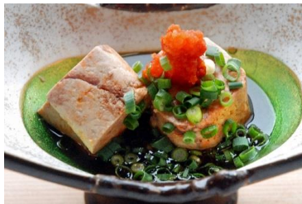
旨味が凝縮している「あん肝」