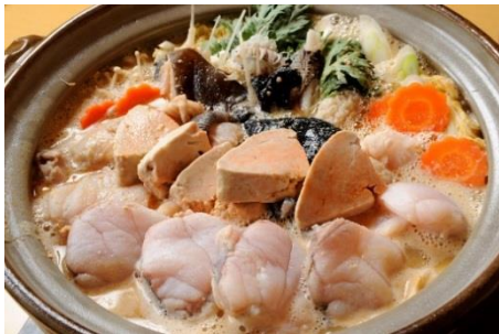
大洗冬の名物「あんこう鍋」

茨城県・大洗町観光情報サイト「よかっぺ 大洗」 URL http://www.oarai-info.jp/top.htm