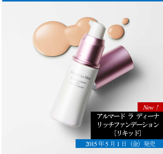
New ! アルマード ラ ディーナ リッチファンデーション [リキッド] 2015年5月1日（金） 発売

これまでの使用感や機能性はそのままに、さらに美肌成分を追加配合、 年齢肌に挑む、美容液リキッドファンデーション