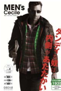
メンズセシール 2015Vol.4 表紙