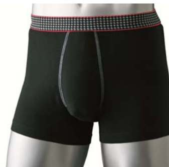
●ボクサーブリーフ・男の安心 品番KB-448 税抜価格…1,490円