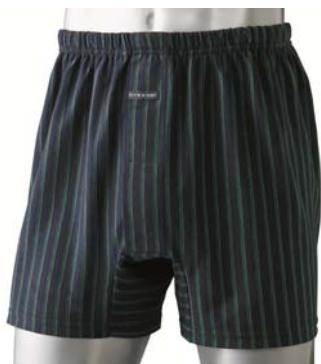
●トランクス・男の安心 品番・KT-417 税抜価格…1,490円