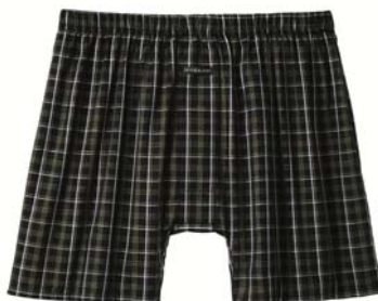
●トランクス・男の安心 品番KT-418 税抜価格…1,490円