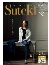
1. 2. 共通 「すてきさろん 2018VOL. 1」 カタログ表紙

■花粉ガード ステンカラーコート M～LL・・・6,990円、3L・・・7,990円（税抜） フードコート M～LL・・・6,990円、3L・・・7,990円（税抜） 色：ライトベージュ、ネイビー、アッシュグリーン ＊中わたライナー付き