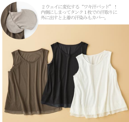
2ウェイに変化する“ワキ汗パッド”！ 内側こしまってタンク1枚での汗取りに 外に出すと上着の汗染みもカバー。

「吸汗・速乾ワキ汗取りパッド付きリヨセルコットンタンクトップ」は、吸汗・速乾機能素材に、脇にも同機能素材で内側に収納できる薄手の汗取りパッドが付いているのが特長。タンクトップを1枚で着る時には汗取りパッドを内側にしまっ、また、上着を重ね着する時には外に出して上着までパッドを渡して2ウェイで着られます。