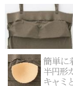
簡単に着脱できる 半円形カップ。ブラ キャミとしても。

胸元と脇のチラ見えを防止するキャミソール。アジャスター付きのストラップも取り外しができ、ずり落ちにくいチューブトップとしても着られます。