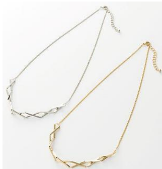
スパイラルネックレス 1,990 円