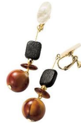
アンティーク調デザイン イヤリング 1,990 円