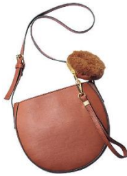
レトロデザインバッグ 4,990 円