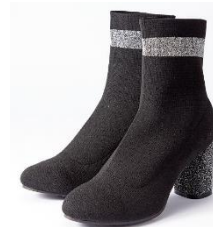
ラインソックスブーツ 3,990 円