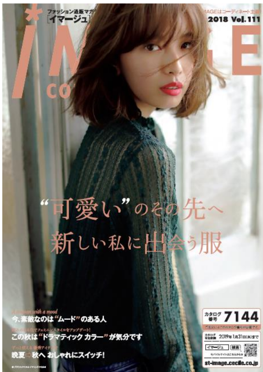
IMAGE COLLECTION 2018 秋冬 Vol.111