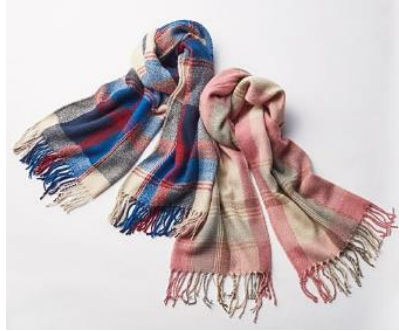
チェック柄フラッフィーストール 1,990 円