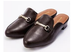
ビットローファーサボ 4,990 円