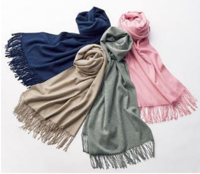
シンプル大判ストール 1,990 円