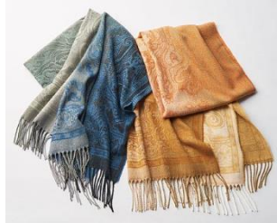
静電気防止ストール 3,990 円