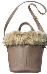
エコファートートバッグ 4,990 円