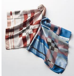
FATTORSETA チェック柄 スカーフ 3,990 円