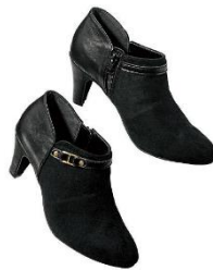
ベルトデザインプーティ 4,990 円