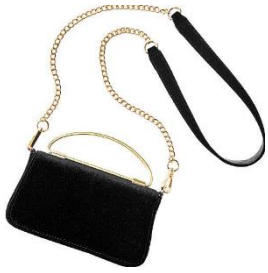
ベルベット使いミニショルダー 4,990 円