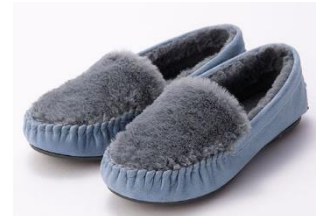
カラーエコファーモカシン 2,990 円