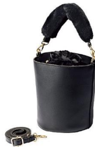
エコファーハンドルショルダ ーバッグ 4,990 円