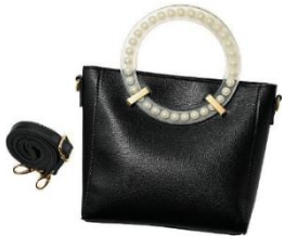
パールモチーフハンドル バッグ 4,990 円