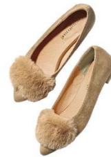
フェイクファー使いローヒール パンプス 3,990 円