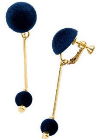
フロッキー素材イヤリ ング 1,490 円