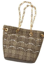
チェック柄パールモチーフ付き バッグ 4,990 円