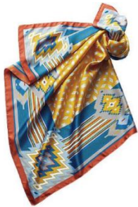
FATTORSETA 幾何学柄 スカーフ 3,990 円