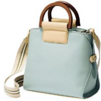
ウッドハンドル2WAYバッグ 4,990 円