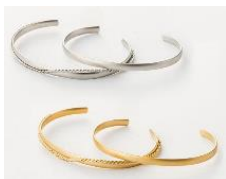
マットメッキプレスレットセット 1,990 円