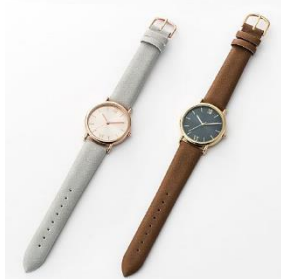
トレンドダイヤルウォッチ 2,480 円