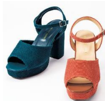
コーデュロヒールサンダル 2,990 円