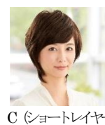
C (ショートレイヤー)