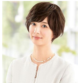
A (ナチュラルショート)

「美活計画」から新発売の「人毛100%地肌付きフルウィッグ」は、自然な風合いが人気の多機能フルウィッグの新バージョン。ナチュラルな分け目の印象をつくとされる内側の「人工皮膚」のサイズを、従来品の約5.5cmから約7cmへと長く改良することでさらに自然な見た目を目指しました。人毛100%のため自分の髪と同じようにスタイリングができます。選べる5種類のヘアスタイルは全てひし形スタイルにデザインされているため小顔効果も。