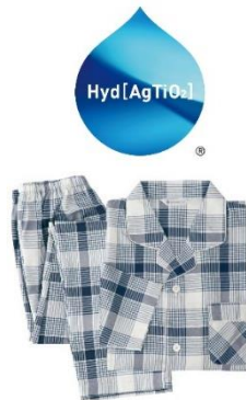
性別を問わず着用しやすいレッドとネイビーのチェック柄

話題の「ハイドロ銀チタン®」を織り込んだ、家族で使える男女兼用のパジャマです。綿 100%素材を使っているため肌に優しく、毎日清潔を保ちながら、心地よく眠れます。