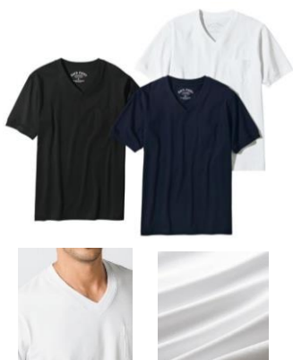
(左) シャツ同様の本縫い仕立てを採用 (右) シルクのような風合い

ワンランク上の品質を楽しめるコスパの高いドレスTシャツが登場。高品質ポリウレタン（スパンデックス）をミックスした編地にシルケット加工を施し、ストレッチ性が高く肌ざわりの良い上質な着心地を実現。さらに、一般的なTシャツとは異なり“シャツ同様の本縫い仕立て”を採用し、きちんと感があつてへたりにくい仕上がりになっています。光沢感のあるドレッシーな美しい見た目は、上品なジャケットスタイルからカジュアルまで、スタイルフリーに楽しめます。