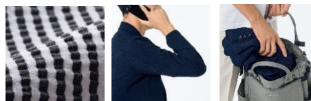
(左) 表面の凹凸感があるサラサラのサッカー素材 (中) ストレッチ性があり動きやすい (右) 丸めてバッグに入れてもシワを気にしなくてOK

表面に凹凸感のあるサッカーは、肌に直接あたる生地面積が少ないためサラサラとした着心地が人気の夏素材。きちんと感と、夏ならではのラフさが絶妙なジャケットです。さらに、このジャケットの生地は、“サッカーなのにストレッチ”という実は珍しい素材で、ジャケットとは思えない快適な着心地を兼ね備えているのが特長。また、サッカー素材の特性上シワが気になること自体が少ないので、バッグに入れて携帯するなどラフに取り扱いができるのも魅力です。