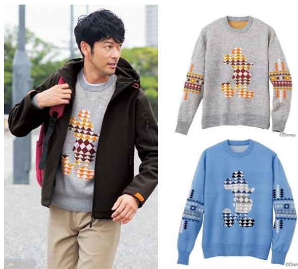
ミッキーマウス柄

ミッキーマウスをトレンドのネイティブ柄で表現した、大人の遊び心のあるデザイン。二重の編み組織となるダブルジャカードの手法による特徴ある色の出方が魅力です。特殊なウール混ニット糸によって形状をキープ。洗濯機で洗えます。