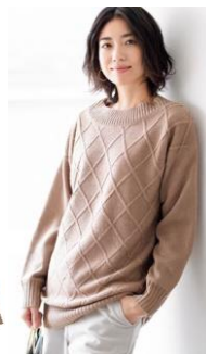
■裏カットソー付き柄編みロングニット