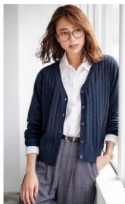
■裏カットソー付き ケーブル編みニットカーディガン