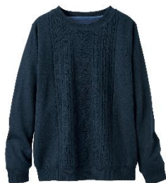
■裏カットソー付き ケーブル編みニットプルオーバー