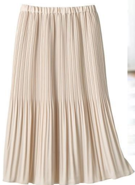
プリーツスカート 4,990 円～ (品番: AZ-1431)