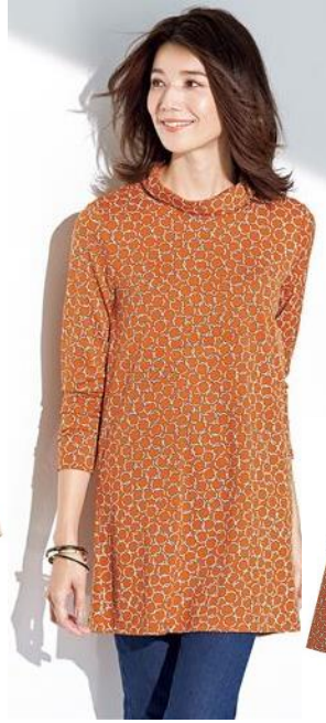
オフタートルプリントチュニック 3,790 円～ (品番: NB-5827)