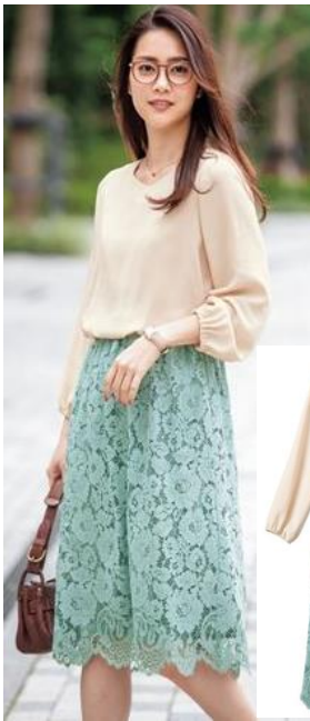
ドッキングワンピース 6,990 円～ (品番: AO-1530)