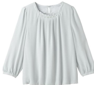
ビジュー使いブラウス 3,990 円～ (品番: AQ-759)