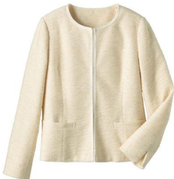
カットソーツイードジャケット 6,990 円～ (品番: AL-964)