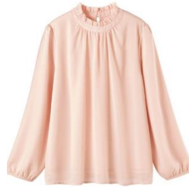
フリル袖ブラウス 3,990 円～ (品番: MW-3018)