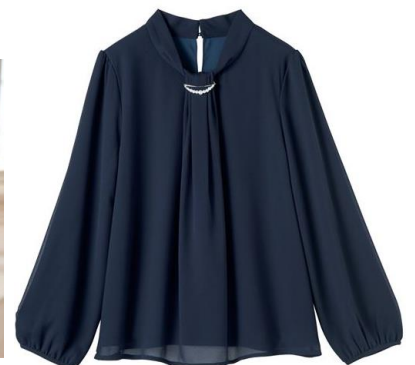
アクセサリ付きボウタイ風ブラウス 3,990 円～ (品番: MW-3019)