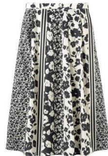
花柄タックスカート 4,990 円～ (品番: AZ-1432)