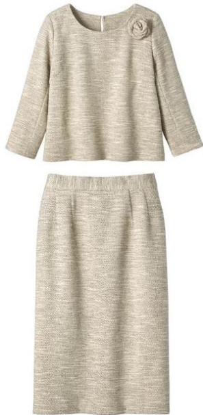
セットアップスーツ(コサージュ付き) 13,990 円～ (品番: AU-607)