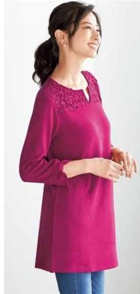
キーネックチュニックカットソー 4,990 円～ (品番: NB-5837)