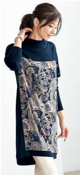
プリント切り替えチュニックカットソー 4,990 円～ (品番: NB-5836)