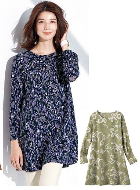
プリントフレアチュニック 3,790 円～ (品番: NB-5828)