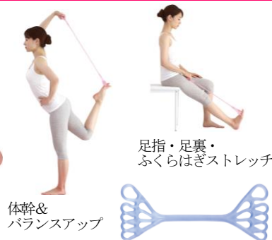
足指・足裏・ふくらはぎストレッチ