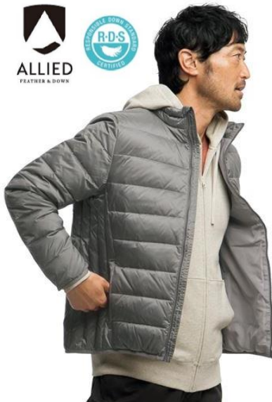
▲ジャケットタイプの着こなし例