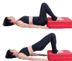
ショルダーブリッジなどヒップラインに効くエクササイズがより効率的に