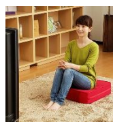
座る時も姿勢が安定