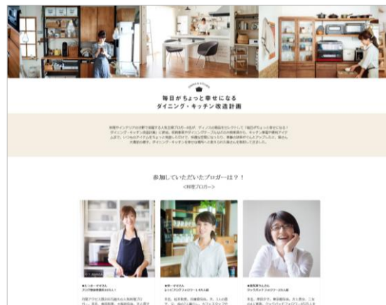
&lt;専用サイトトップイメージ&gt;

商品は、家具・収納を中心に、キッチン雑貨、キッチン家電、調理器具など、実用性とインテリア性を備えた約1,250点をラインナップします。