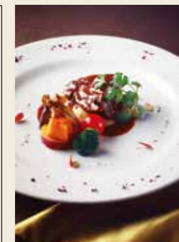
牛ほほ肉の煮込みボルチーニ茸のリゾット添え

※お子様メニューは別途ご用意しております(アイスクリーム付き ¥1,210) ※お子様メニューには前菜は付いておりません