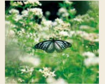
フジノカマ 10月上旬～10月下旬