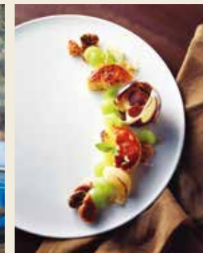
季節のクリエイション ¥1,830