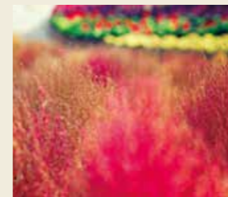
コキア 9月下旬～10月下旬