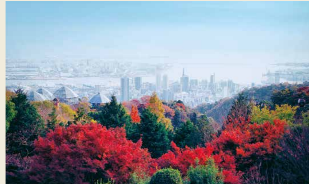
布引の紅葉 11月上旬～12月上旬