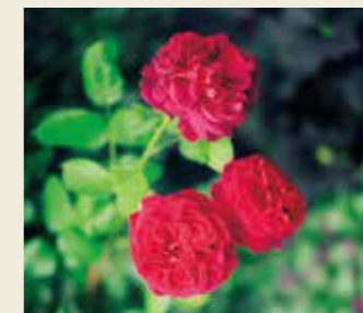
ローズ 10月上旬～11月上旬