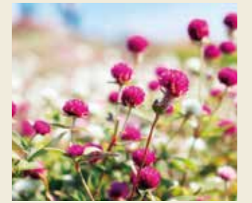
センニチコウ 9月上旬～11月中旬