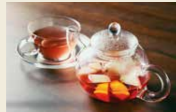
果実のブレンドハーブティー ¥1,230

オリジナルのハンバーガーやスイーツ、ハーブティー、ソフトクリームなどをお手軽にお楽しみいただけます