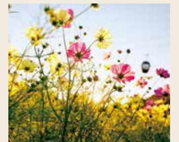
コスモス 10月上旬～12月上旬