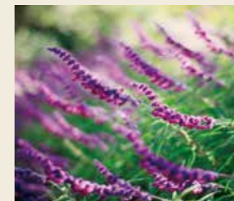
メキシカンブッシュセージ 9月下旬～11月下旬