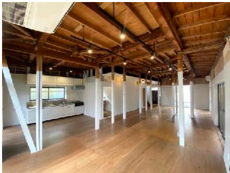
オーナー費用負担無しで再活用する、空き家戸建て借り上げ事業の第一弾「WORKING HOUSE 上池台」の外観と内観