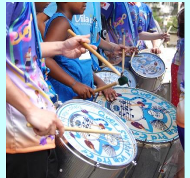
それぞれの国の「打楽器」を演奏する4団体がこの日限りで集結!