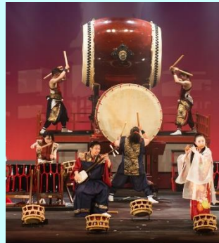
↓スティールパン ↑和太鼓

アンサンブルサミット実行委員会は、 アメリカ、トリニダード・トバゴ、ブラジル、日本の打楽器パフォーマンスを行う、ジャンルの違う4つのパーカッション団体の奇跡のコラボレーション によって実現する未知のライブイベント「アンサンブルサミット 2022 ~リズムにのって地球一周!!~」を、 2022年10月29日(土)に神奈川県横須賀市にある横須賀芸術劇場小ホール(ベイサイドポケット)にて初開催 します。