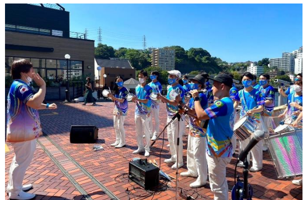
当日の演奏の様子 (ケール・スウィンガール・ヴェン・ブラ・カ)

・オフィシャルサイト： https://ensemble-summit-2021.studio.site/