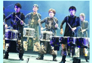
↓サンバ ↑マーチングドラム