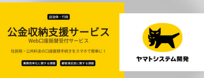
ヤマトシステム開発(株)