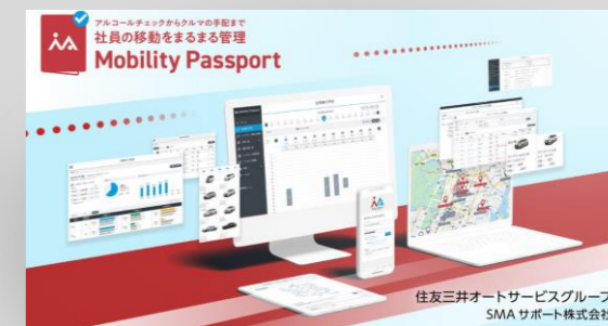
(モビリティ・パスポート)