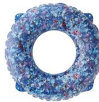
Plantica あぐらチェア Plantica クーラーメッシュリュック Plantica SWIM RING 90