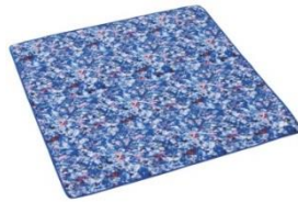
Plantica コンパクトフルシェード Plantica 防水ビーチマット