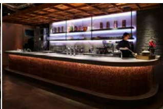
※「伊右衛門サロン 渋谷ヒカリエ店」（東京・渋谷）