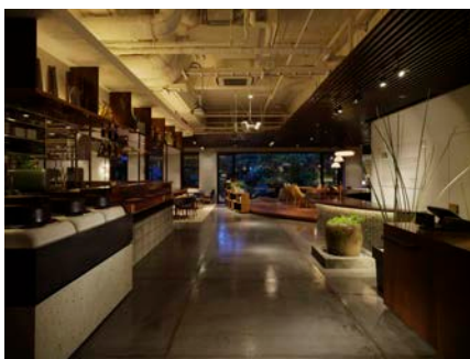
※移転前 / 現在は閉店 「伊右衛門サロン 京都」（烏丸三条）