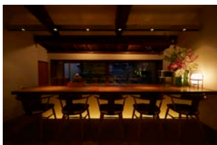
※「伊右衛門サロン アトリエ 京都」（京都・東山）