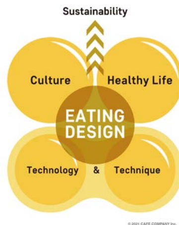
【Eating Design 概念図】

「イートテック=食べることの進化」を通じて社会の在り方をデザインし、日本の食文化、そして、世界の食の持続可能性に貢献する「Eating Design Company」を目指します。