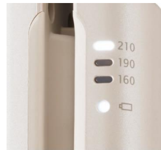
※画像はパールグレージュです。