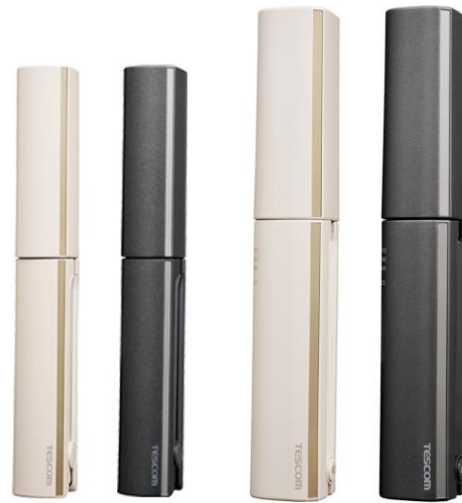
左から：TS310A -C（パールグレージュ） / -H（メタリックグレー） TS510A -C（パールグレージュ） / -H（メタリックグレー）