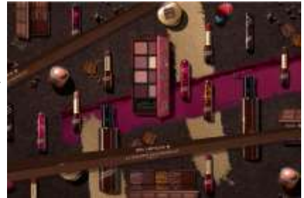
『ラ・メゾン・デュ・ショコラ×シュウ ウェムラ コレクション』 第1弾 全15アイテム 11月1日(木)限定発売 10月25日(木)予約開始 ※本品は食べ物ではありません。 ※写真はイメージです。

TOKYO 発メイクアップ アーティスト ブランド シュウ ウェムラから待望のホリデーコレクション『ラ・メゾン・デュ・ショコラ×シュウ ウェムラ コレクション』が11月1日(木)に第一弾、11月16日(金)に第二弾と分けて発売を迎える。今年パリの高級チョコレートブランド、ラ・メゾン・デュ・ショコラと共演。甘く、時にビターなショコラの世界観をメイクアップで表現し、女の子なら手に取らずにはいられないほどに甘美で、美しいコラボレーションが実現した。自分へのご褒美はもちろん、クリスマスプレゼントとしてもおすすめ。第一弾はリップやアイシャドーなど全15アイテムで登場し、10月25日(木)から予約がスタート。毎年売れ切れ必至なシュウ ウェムラのホリデーコレクションをゲットしたいと思っているあなたは、ぜひ店頭で予約して、ホリデーシーズンのメイクに備えて。(※第二弾の予約は11月1日(木)スタート)