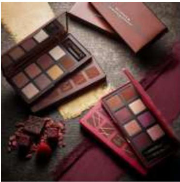
『ガナッシュ アンド ブラネ アイパレット』 2018年11月1日(木) 限定発売 限定2種 各7,500円(税抜) 左:ダーク カカオ 右:フランボワーズベリー

甘い香りと色合いが、まるで豪華なショコラの詰め合わせのようなアイシャドーパレット。赤みを帯びたフェミニンカラーが揃うフランボワーズベリー(写真右)と、ダークカラーが揃い普段使いにぴったりなダーク カカオ(左)の限定2種が登場。それぞれ8色のアイシャドー全て、このコレクションだけの限定カラーで、ハイライトから締め色まで多様な色と質感で展開。キュートからエッジイまで何通りのメイクを、1つのパレットで楽しんで頂けます。そして、なんといっても香りまでチョコレート！まさしくショコラの世界観をたっぶり味わえる見逃せないイチオシアイテムです。